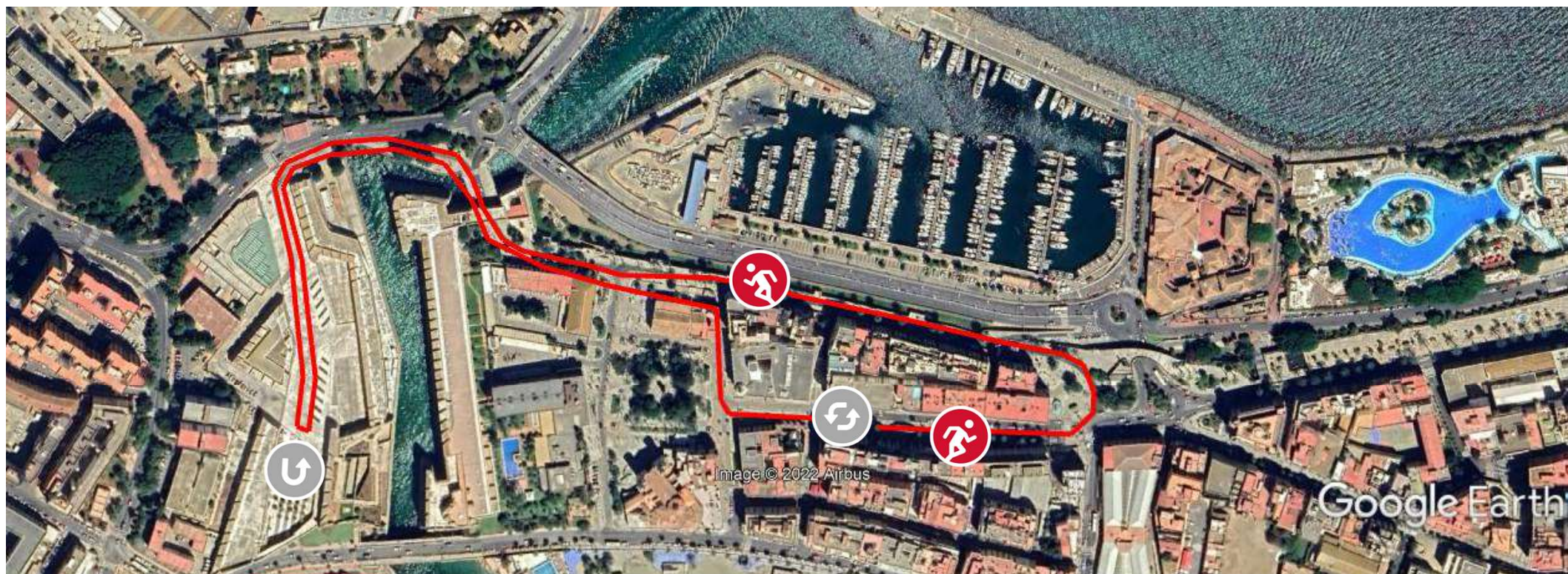
Gráfico: min.: media: máx.: Elevación: 6. 10. 16 m

Total de intervalo: Distancia: 1.62 km Incremento/pérdida de elevación: 23.1 m. -24.1 m Pendiente máxima: 6.8%, -11.4% Pendiente media: 2.3%, -2.6%